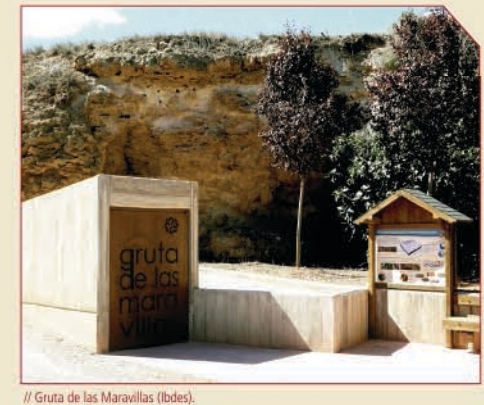
// Grotto of Las Maravillas (Ibdes).

Up to Ibdes, we walk on this road through the fertile plain of the river and at the foot of the Bank conglomerates. Near the ice well, in the vicinity of Ibdes, we arrive at a crossing of the GR which to the right, runs toward Lumes and Nuévalos and to the left, continues to Ibdes. The trail crosses the river, passes by the grotto of Las Maravillas and finishes on the road, opposite the village.