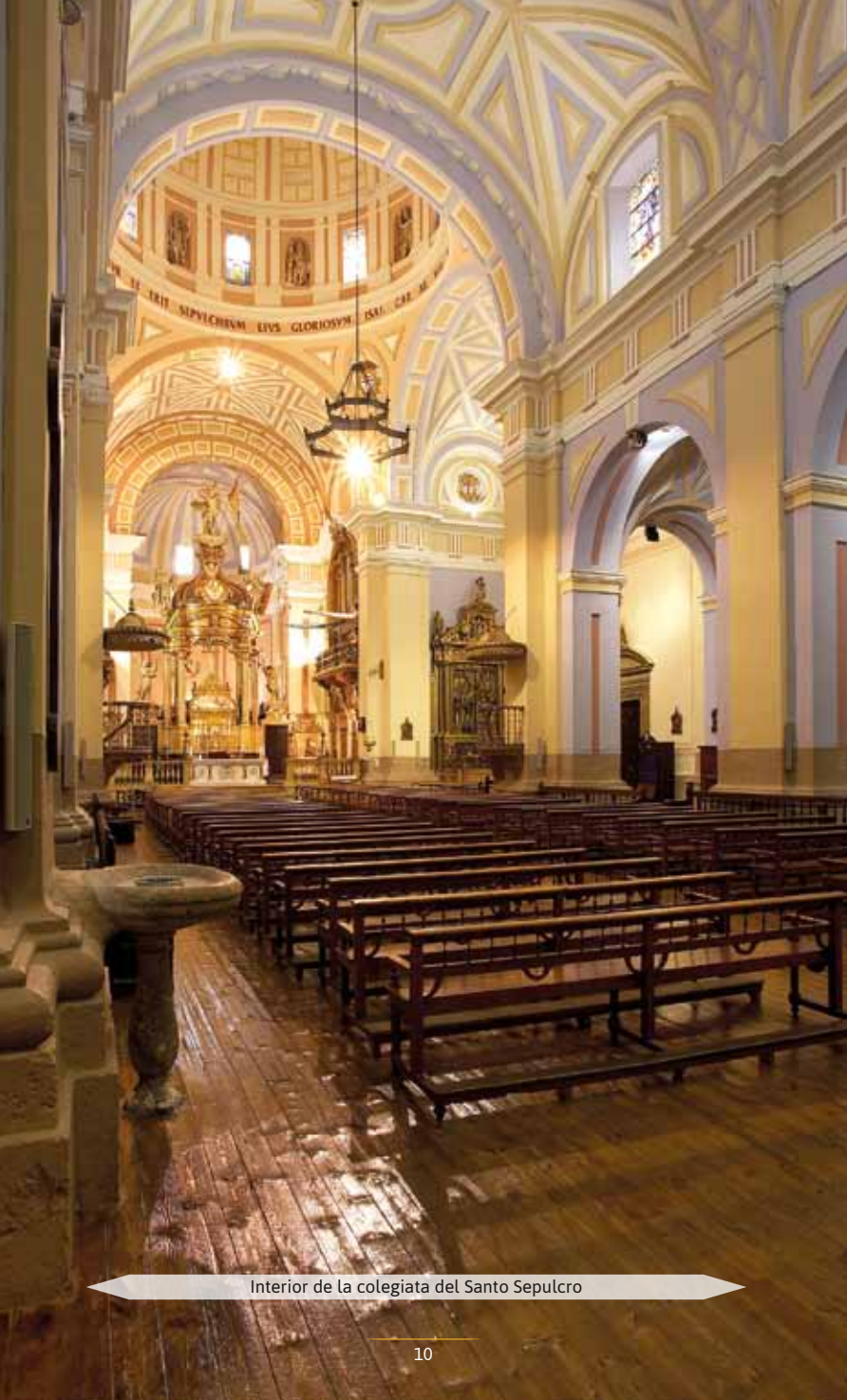
Interior de la colegiata del Santo Sepulcro

La leyenda desencadenó un torrente de obras literarias, musicales y cinematográficas. El escenario del drama, una posada aragonesa, instalada en un edificio renacentista, recibió el nombre popular de “Mesón de la Dolores”, hoy restaurado y convertido en hospedería. Un completo museo, situado en las antiguas caballerizas, recoge documentos, datos y curiosidades sobre la Dolores y su tiempo.