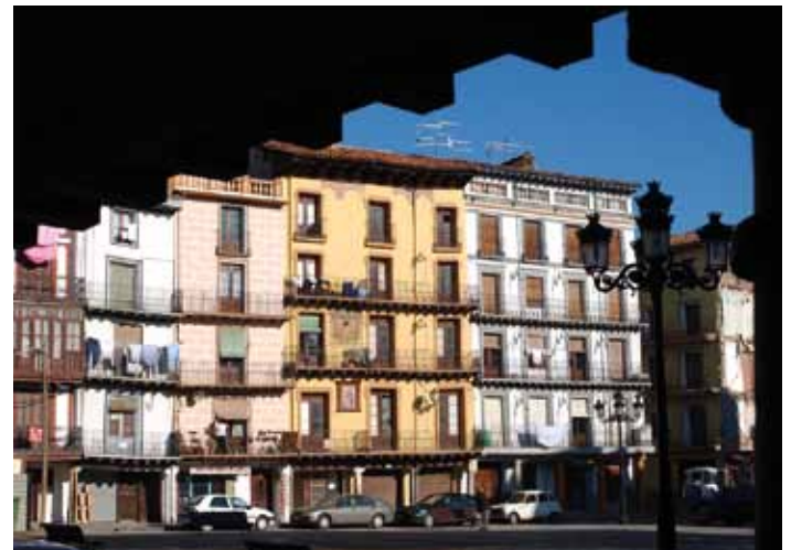
Plaza de España