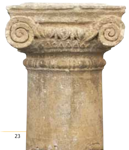
Resto de columna. Museo de Calatayud

Las termas públicas (3) tienen buena conservación. Están en la parte alta y cuentan con dos grandes cisternas que no funcionaron simultáneamente, pues son de dos momentos diferentes, lo mismo que las propias termas, que fueron objeto de una gran reforma. El conjunto visible hoy es el más reciente, con entrada por el sur y estancias distinguibles: el apodyterium (vestuario) da paso sucesivamente a la sala de baños fríos o frigidarium , al tepidarium o sala templada y al caldarium , con calefacción bajo el suelo y por las paredes. La instalación estuvo ampliamente decorada con mosaico en los suelos y pinturas parietales. Estas, ricas en composiciones y decoraciones, son uno de los mayores atractivos del yacimiento, por su importancia y conservación. Bilbilis ha sufrido numerosos expolios por usarse como cantera para construcción de los principales edificios y monumentos de Calatayud. La plaza de toros, del siglo XIX, tiene en sus bases materiales de la ciudad romana.