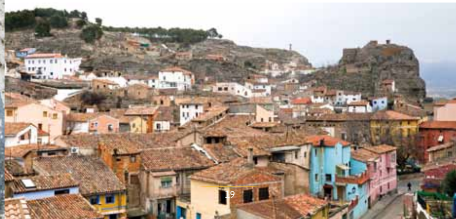
Vista de la antigua morería desde la calle Torremocha

Hoy se puede contemplar la judería bilbilitana como una de las más importantes y mejor conservadas. Un paseo por la parte alta de la ciudad permite vislumbrar una porción del esplendor de la comunidad judía ya que el trazado de las calles y la disposición de las casas, formando angostos espacios, no ha variado demasiado. Se conservan también la fachada de la sinagoga mayor y la sinagoga de tejedores, muestras de una cultura que pervivió durante siglos en la ciudad.