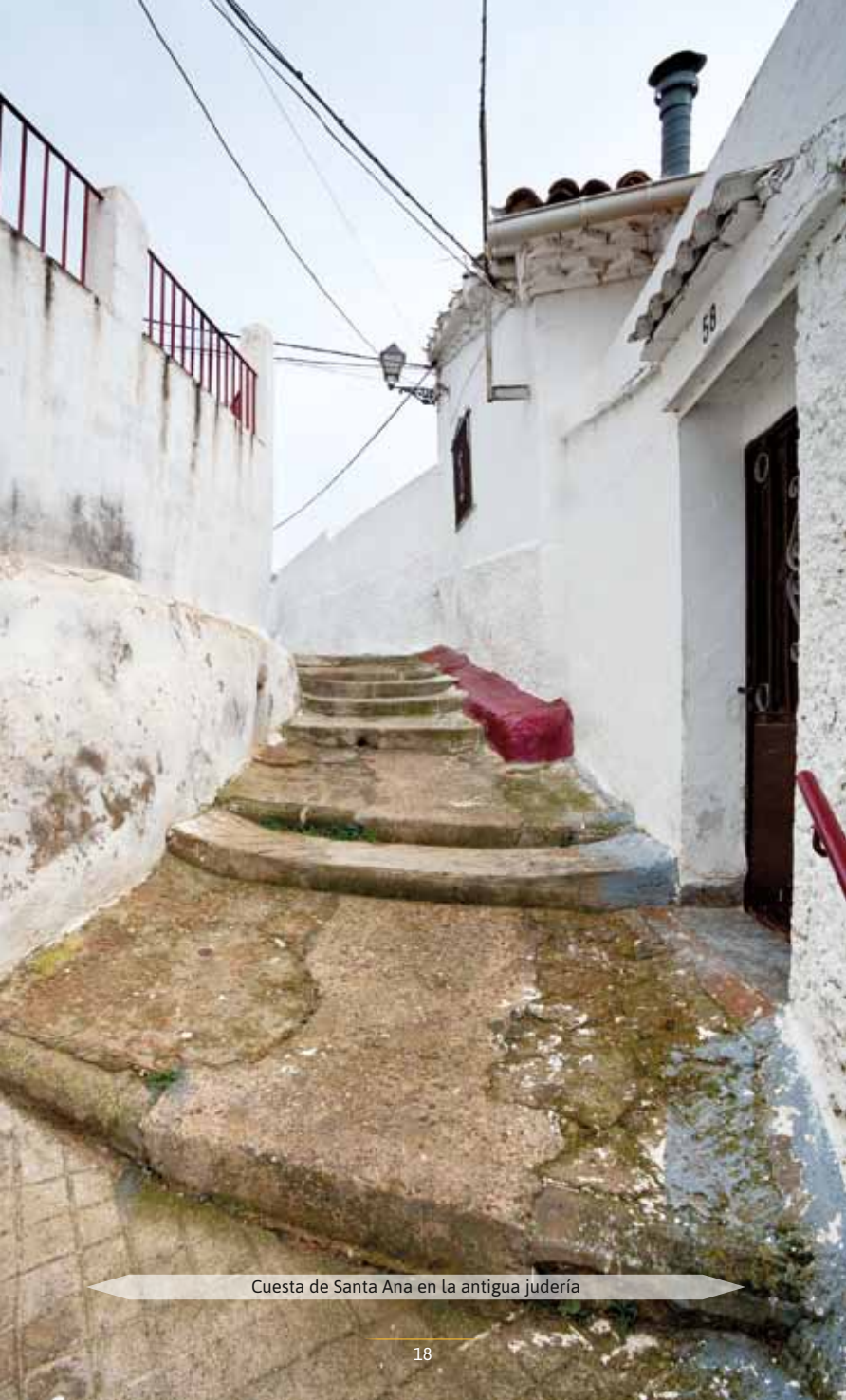
Cuesta de Santa Ana en la antigua judería

A fines del siglo XII la ciudad contaba con una comunidad judía que rondaba las 185 familias (unas 900 personas), cifra que fue aumentando hasta el siglo XIV, momento en el que sus índices disminuyeron debido a la peste negra, la intervención inquisitorial y sobre todo la guerra con Castilla (1356-1369), ya que la toma de la ciudad por las tropas castellanas supuso la destrucción de buena parte de la judería.