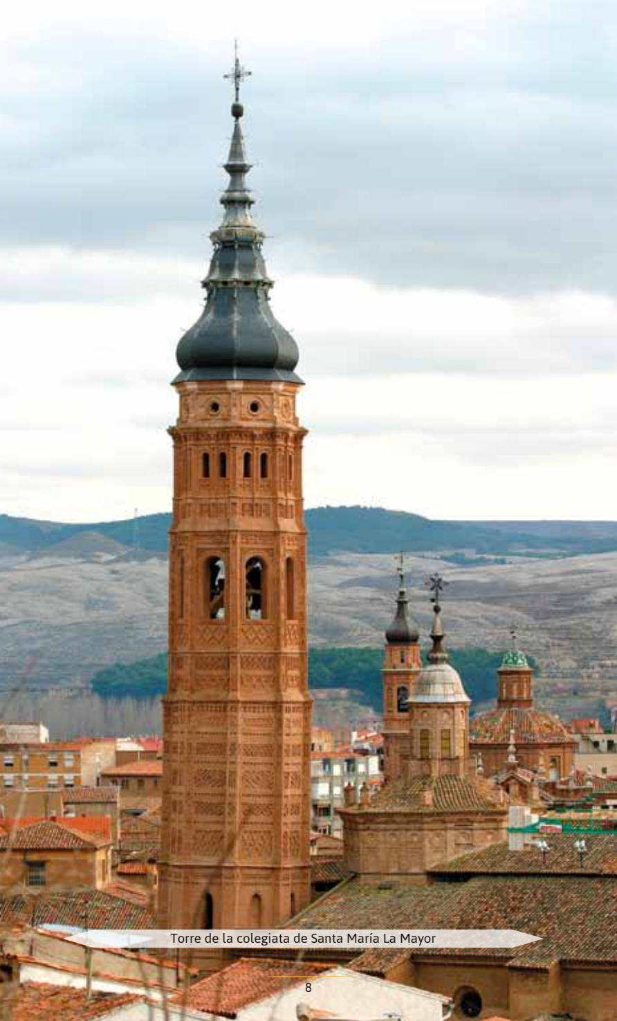
Torre de la colegiata de Santa María La Mayor

Se desciende para adentrarse y callejear por la antigua judería, acotada por la base de otros dos castillos, la Torre Mocha y el de Doña Martina, ambos cerrados al público. En el centro del barrio judío se encuentra la iglesia de Nuestra Señora de la Consolación (5), antigua sinagoga. Descendiendo por la cuesta de Santa Ana se llega a la iglesia de San Andrés (6), poseedora de una torre mudéjar de gran belleza, terminada en 1508. Esta iglesia, que fue mezquita, muestra en su interior diversas fases constructivas entre los siglos XIV y XV. A la derecha del templo se levanta el teatro Capitol (siglo XX).