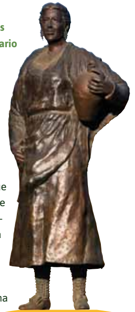
Monumento a La Dolores

Desde la plaza se toma la calle de la Fuente, que lleva hasta la plaza de España (8), porticada y de origen medieval, aunque muy modificada en distintas épocas. El edificio más representativo es la antigua casa consistorial, del siglo XVII, también modificada. A pocos metros, en el plaza de los Mesones, está la Hospedería Mesón de la Dolores, edificio restaurado a finales del siglo XX. Es una típica hospedería aragonesa del siglo XIX, construida sobre un palacio renacentista.