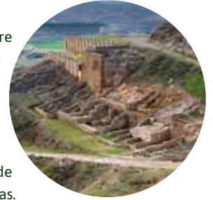
Yacimiento de Bilbilis

El foro (1), en la zona central de la ciudad, sobre el cerro de Santa Bárbara, centró la vida urbana, coronado por un templo sobre podio del culto imperial, probablemente hexástilo (seis columnas en la fachada) y períptero (rodeado de columnas), al que se accedía por una gran escalera. La plaza, de 50 m, estaba rodeada de pórticos, tiendas y otras construcciones públicas.