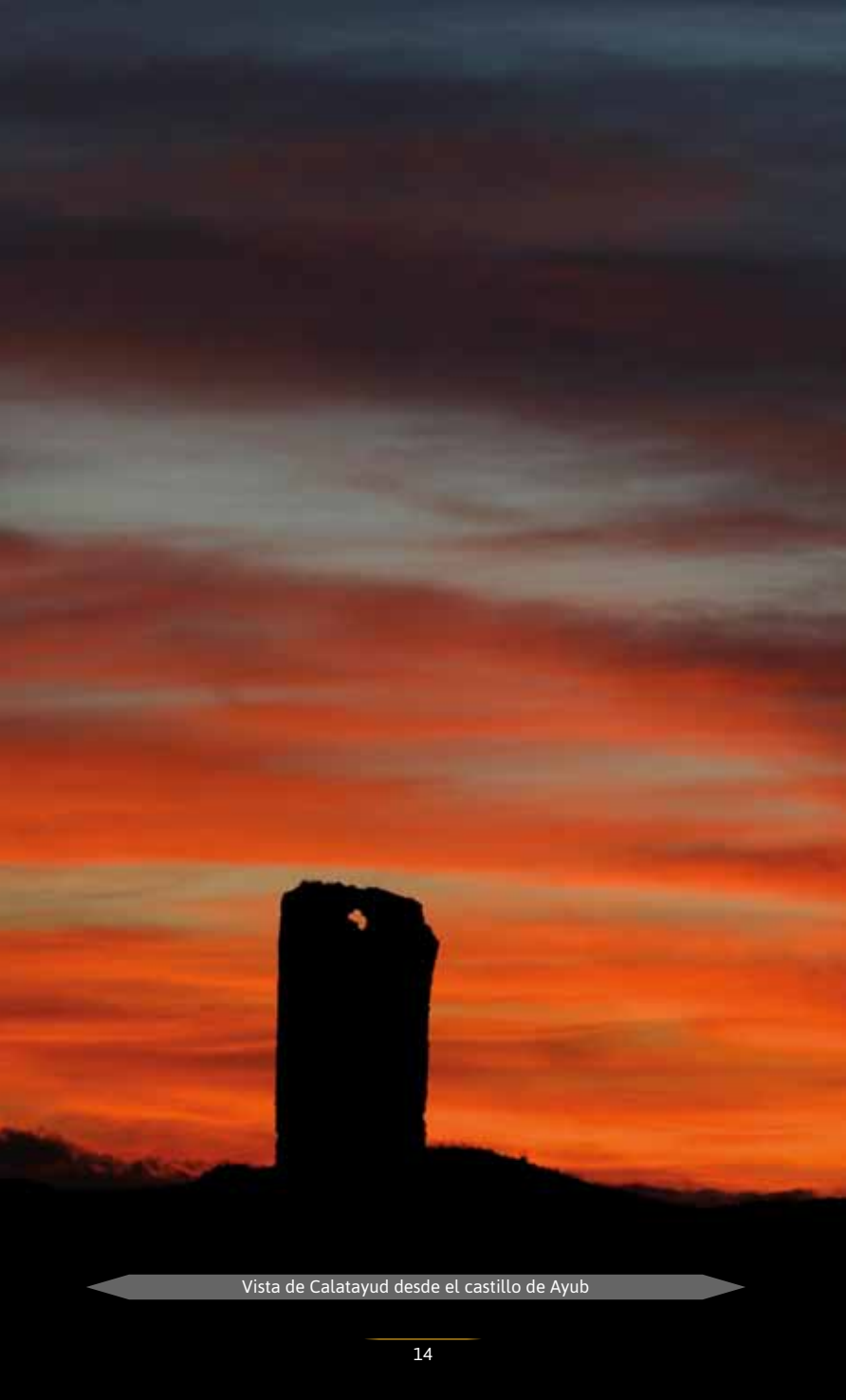
Vista de Calatayud desde el castillo de Ayub