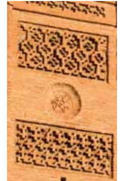
Detalle de la torre de San Andrés

Se desciende para adentrarse y callejear por la antigua judería, acotada por la base de otros dos castillos, la Torre Mocha y el de Doña Martina, ambos cerrados al público. En el centro del barrio judío se encuentra la iglesia de Nuestra Señora de la Consolación (5), antigua sinagoga. Descendiendo por la cuesta de Santa Ana se llega a la iglesia de San Andrés (6), poseedora de una torre mudéjar de gran belleza, terminada en 1508. Esta iglesia, que fue mezquita, muestra en su interior diversas fases constructivas entre los siglos XIV y XV. A la derecha del templo se levanta el teatro Capitol (siglo XX).