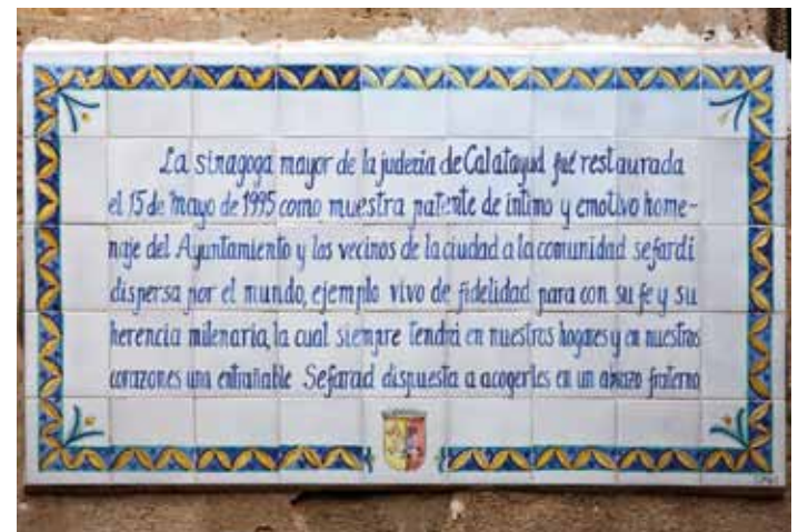
Placa alusiva a la sinagoga mayor de Calatayud