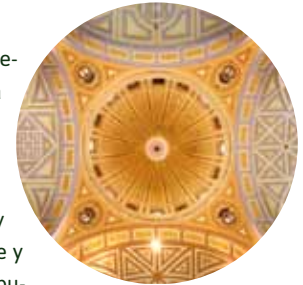
Colegiata del Santo Sepulcro

En la misma calle, tras un corto paseo, la colegiata del Santo Sepulcro (9) muestra su figura sobria, obra de Gaspar de Villaverde (siglo XVII). Templo de estilo herreriano, los ocho altares laterales cuentan la Pasión de Cristo con sugerentes relieves. En el altar mayor hay un solemne baldaquino, con un Cristo yacente y rematado con la imagen del Resucitado. La cúpula recuerda lejanamente a la de San Pedro del Vaticano.