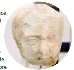
Busto de época romana. Museo de Calatayud

El urbanismo se adaptó a la topografía. Parece aceptarse hoy que la ciudad se alzó sobre el asentamiento indígena, sin migrar de otro emplazamiento previo. Completamente reurbanizada, su muralla abrazaba 30 ha y sus calles y espacios públicos se acomodaron mediante terrazas comunicadas a través de rampas y escaleras. Roma le otorgó el nombre de Augusta Bilbilis y el privilegiado estatuto de municipio de ciudadanos romanos.