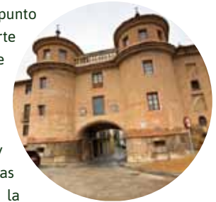
Puerta de Terrer

Siguiendo a la izquierda por la avenida de San Juan se accede a la amplia avenida de Ramón y Cajal, que termina en dos monumentos civiles de mediados del siglo XVI: la fuente de los Ocho Caños o de la Sisa y la Puerta de Terrer (3), sede del Centro de Estudios Bilbilitanos, con dos torreones y un arco central. Se avanza por la Ronda Puente Seco para, tras la ascensión de una suave cuesta, visitar el santuario de Nuestra Señora de la Peña (4), construido y reconstruido sobre el solar del castillo de la Peña.