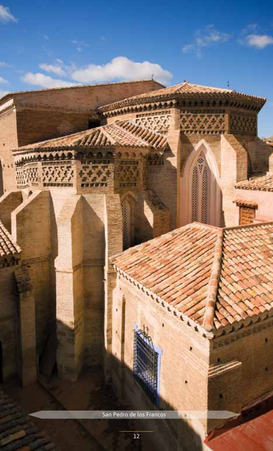
San Pedro de los Francos

En la misma calle, tras un corto paseo, la colegiata del Santo Sepulcro (9) muestra su figura sobria, obra de Gaspar de Villaverde (siglo XVII). Templo de estilo herreriano, los ocho altares laterales cuentan la Pasión de Cristo con sugerentes relieves. En el altar mayor hay un solemne baldaquino, con un Cristo yacente y rematado con la imagen del Resucitado. La cúpula recuerda lejanamente a la de San Pedro del Vaticano.