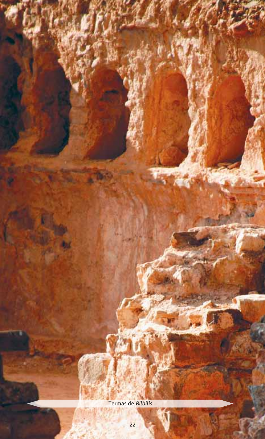
Termas de Bilbilis

El foro (1), en la zona central de la ciudad, sobre el cerro de Santa Bárbara, centró la vida urbana, coronado por un templo sobre podio del culto imperial, probablemente hexástilo (seis columnas en la fachada) y períptero (rodeado de columnas), al que se accedía por una gran escalera. La plaza, de 50 m, estaba rodeada de pórticos, tiendas y otras construcciones públicas.