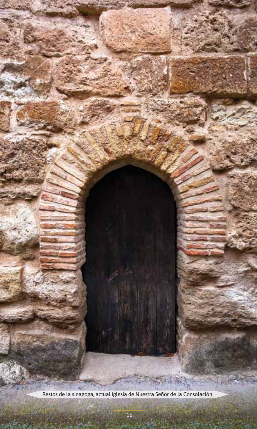
Restos de la sinagoga, actual iglesia de Nuestra Señora de la Consolación

Los judíos de Calatayud eran propiedad real, rendían cuentas al rey directamente y se asentaban en la zona alta de la ciudad, a los pies del castillo de Doña Martina, flanqueados por los barrancos de Soria y del Puente Seco.